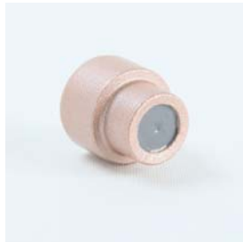
Abb 2.: Schnittzeichnung und Foto TungStud