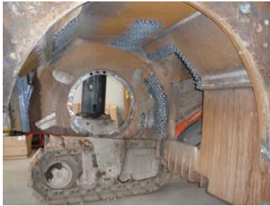
Abb 1.: Straßenfräsen-Walzengehäuse bestückt mit TungStuds